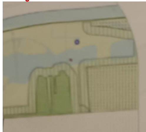
...Les STECAL ont disparus...

Tout récemment, Dans un 3 ème document (réponses des communes) : une 3 ème version surgit : 1 STECAL sera réduit, mais un EBC (Espace Boisé classé) sera sacrifié. Quel sera le bilan environnemental ? Rien n'est explicite : aucune donnée de surfaces, et aucun projet détaillé. La méthode est bien rodée : Brouiller les pistes et choisir seul.