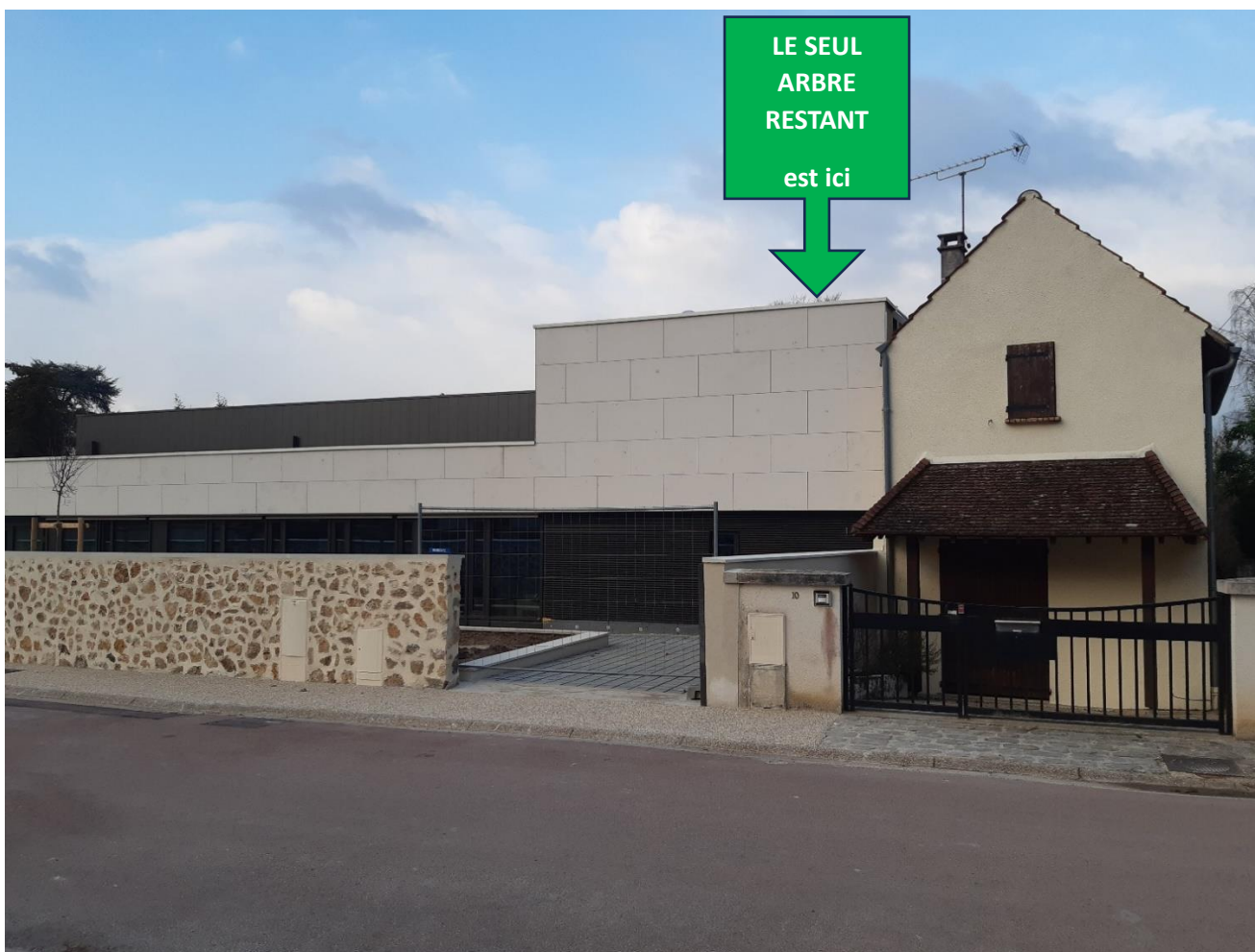
▼ APRES : L'INSERTION PAYSAGÈRE SELON LA MAIRIE DE BLR & LA CAPF (un aperçu de ce que peu produire partout le PLUi)