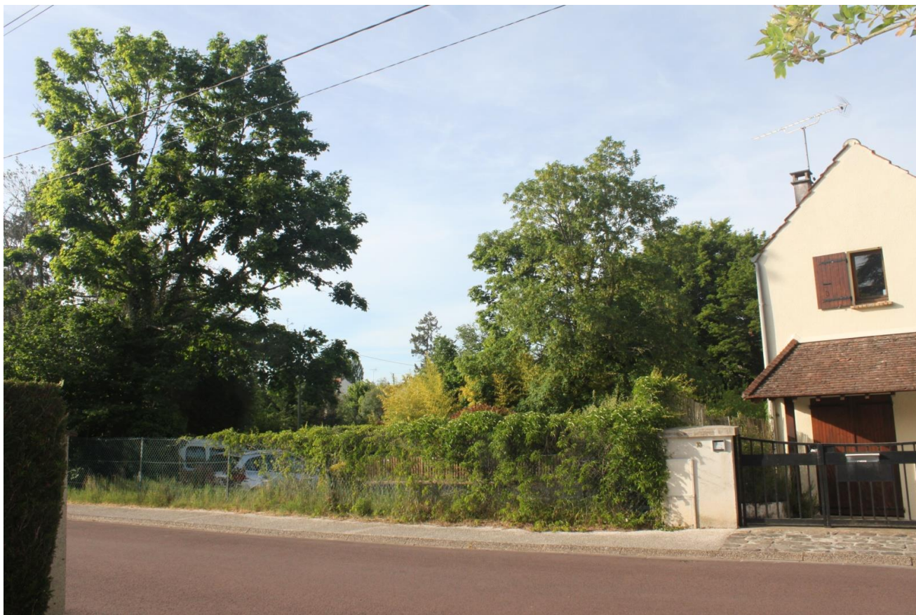
▲ AVANT : JARDIN avec grands arbres